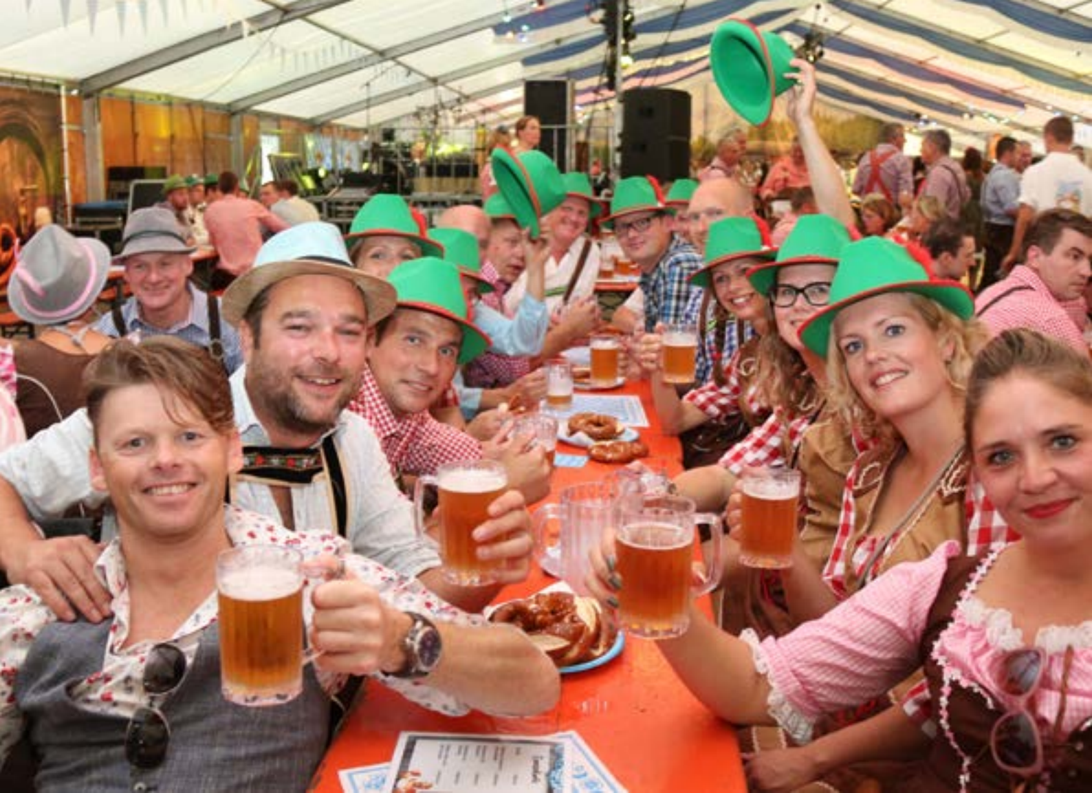
▶ Met zijn allen uit bierpullen drinken in Duitse klederkracht: dat scheidt een band.

een Duits fenomeen dat eerst in het oosten van Nederland ingang vond en dat daarna doorsijpelde naar het westen van het land.