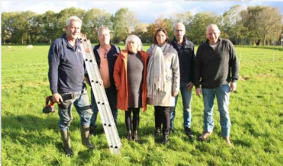
▲ Het bestuur van de Ijsclub Delfgauw droomt van een gezellig volle baan met dartelende schaatser.

zelfs zeven respectievelijk acht dagen geschaatst kan worden op de prachtige baan van Pijnacker, waar ook een echte 400 meter uitgezet kan worden. Maar, dus ook als er geen enkele ijsdag te noteren is in de winter 23/24, dan nog gaan deze heren welgemoed door met hun werk.