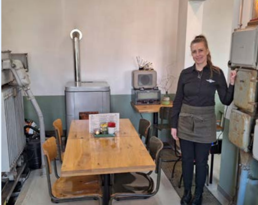
▲ In de lunchroom is nog oude originele apparatuur te zien.

Er is ook volop aandacht voor de historie van het vliegveld en de toren. Op de site is een film te zien, die is gemaakt door Jan Voorn die vanaf 1956 tot 1964 in de verkeerstoren werkte als verkeersleider. Het in 1936 als sportvliegveld geopende Vliegveld Ypenburg is vanaf rond 1950 omgevormd tot militair vliegveld en heeft tot begin jaren tachtig zo gefunctioneerd. De verkeerstoren is ook pas gebouwd toen het een militair vliegveld werd. Vanaf 1937 tot 1968 zijn er heel veel vliegshows gehouden die op de film