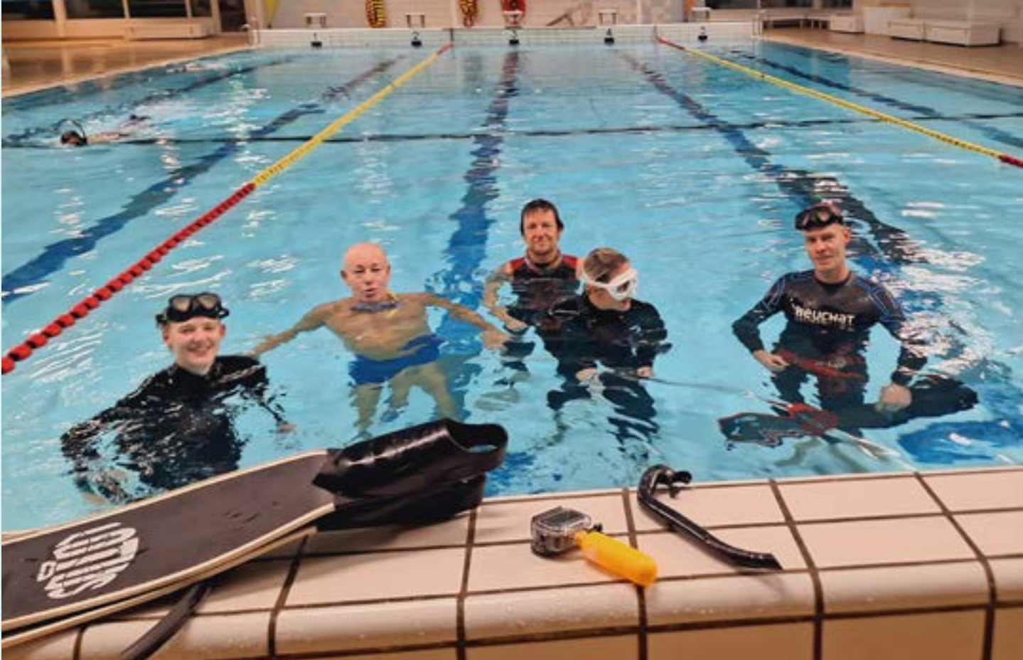
🔹 Zwembad De Viergang is een oase van rust zodra de duikers van Abyss er bezit van nemen. Voor de foto komen ze even boven water.

lucht werken. Beide groepen duikers gaan prima samen. Iedereen doet zijn eigen ding in het water en er is ruimte zat. Ook voor twee nieuwkomers die de schoonheid van het duiken willen proberen te ontdekken.”